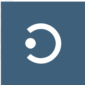
OUTREACH & INTERGRATION

Ob es um akademische Angelegenheiten, oder Freizeitgestaltung geht, ist ISUS immer aktiv tätig. Es werden u.a. Bücherbörsen, kulturelle und Sportevents organisiert, sie sind aber auch bei sozialen Projekten der Stadt mit vollem Einsatz dabei!