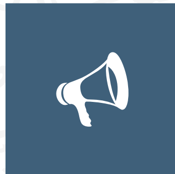
PR & MEDIA