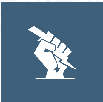
STRIKE FORCE TEAM